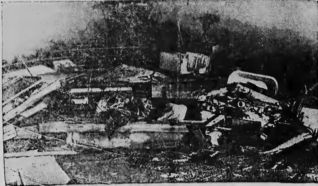
Gisteravond en vanochtend werden de Verenigde Staten wederom door een wervelstorm getroffen. Tot nu toe zijn er reeds 79 doden te betreuren, terwijl meer dan 2500 mensen dakloos werden. Op verschillende plaatsen veroorzaakte de storm overstromingen. Hierboven een foto van een getroffen gebied. Ook weerlandigen beginnen het thans merkwaardig te vinden, dat de stormen elkaar zo snel en bijna dagelijks opvolgen.

In Britse regeringskringen verhaalt, dat op geen enkele vergade-